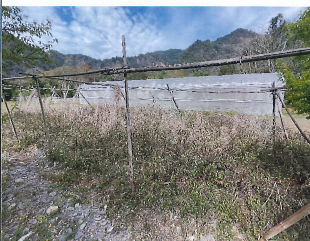
位置：X: 258846.71 Y: 2651185.69 說明：松林分廠區門口臺灣大豆復育區，植株已於前一季完成採收保種，本季尚未重新播種，待氣候適合時將重新栽植。