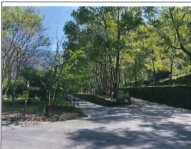
位置：X: 263508.76 Y: 2652258.15 說明：霧社血斑天牛棲息之櫻花林區域，本案工程已規劃進行迴避，避免受工程擾動，目前相關工程皆尚未進行施作。