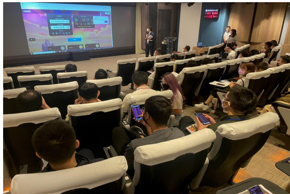
全場競答遊戲過程