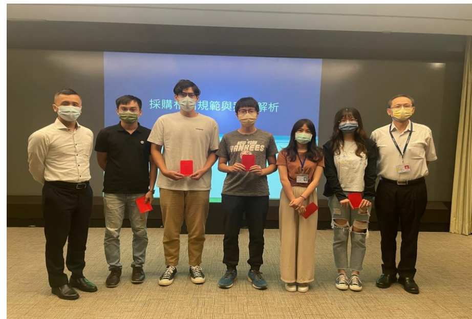
全場競答得獎人員合影