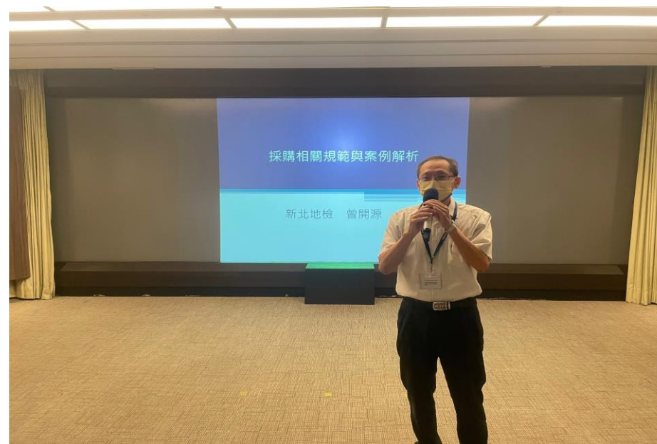
政風處林處長引言