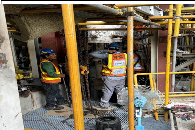
主發電設備工程 Unit 1 ST 廠房 設備安裝