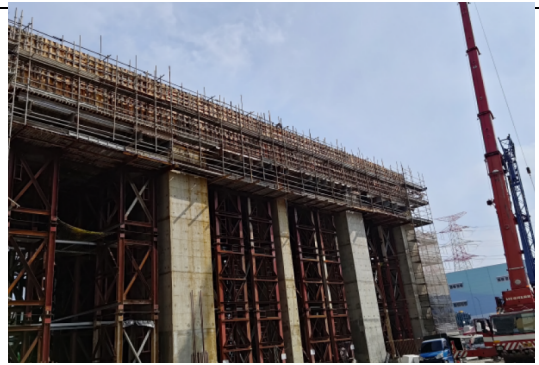
主發電設備工程 海水電解房 結構體