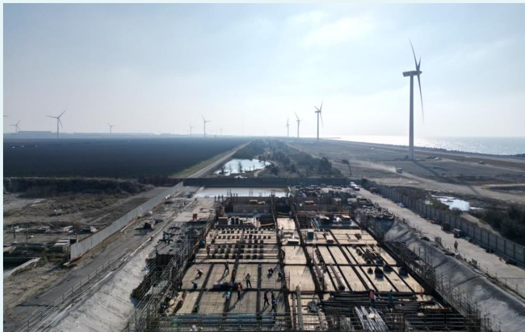
陸上電氣室12月施工空拍圖