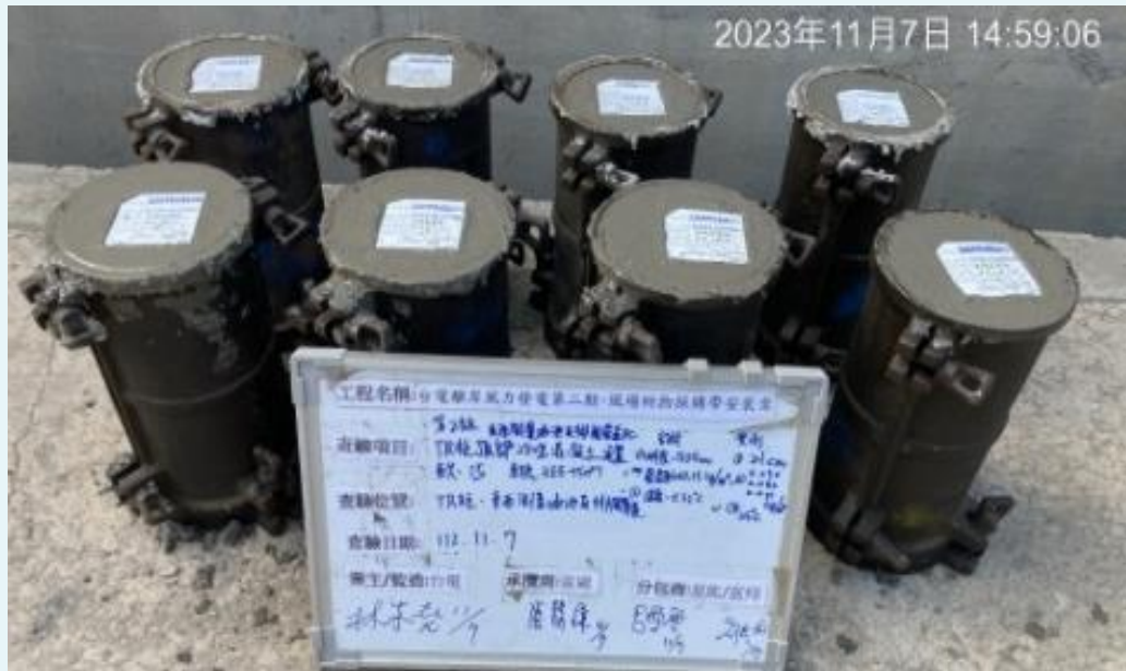
陸上電氣室B1F TR柱、頂板及西側集油池(PC)混凝土澆置施工抽查