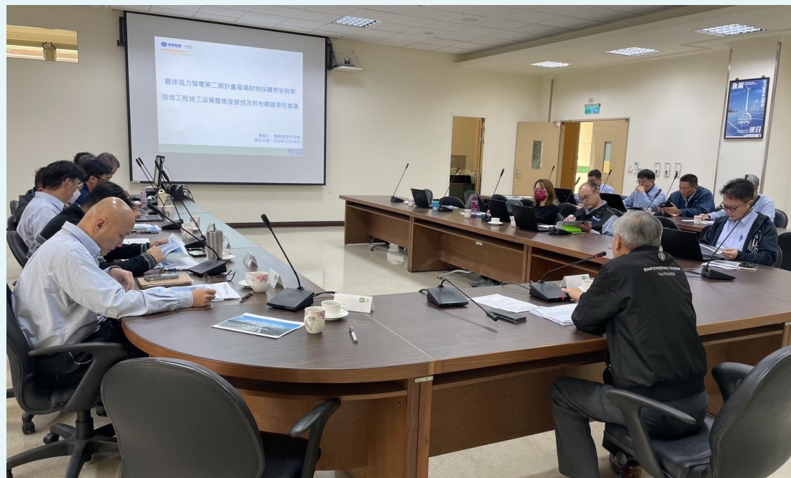
主席林廠長明成結語