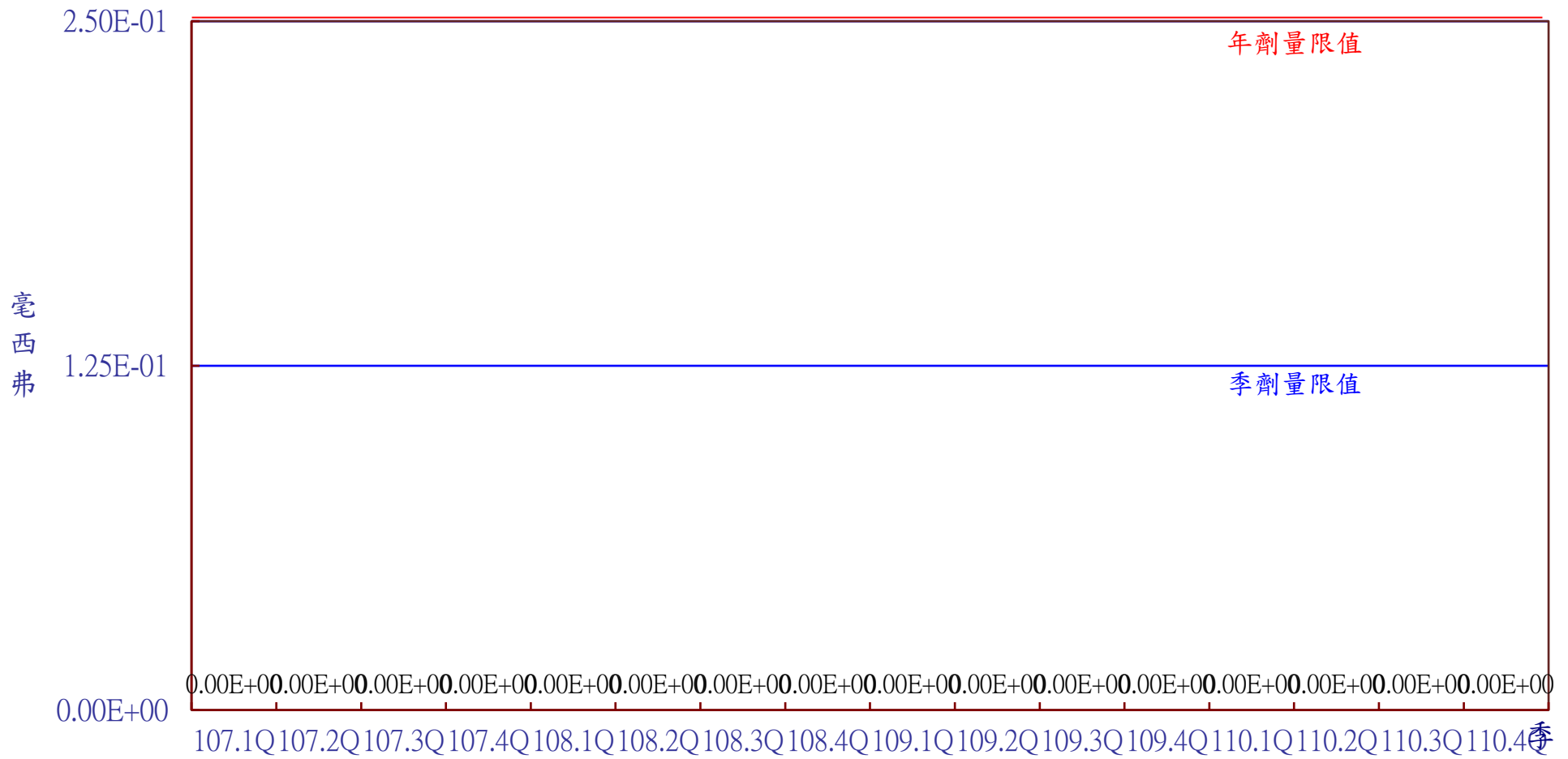
圖5 低放貯存場民眾最大個人全身劑量結果