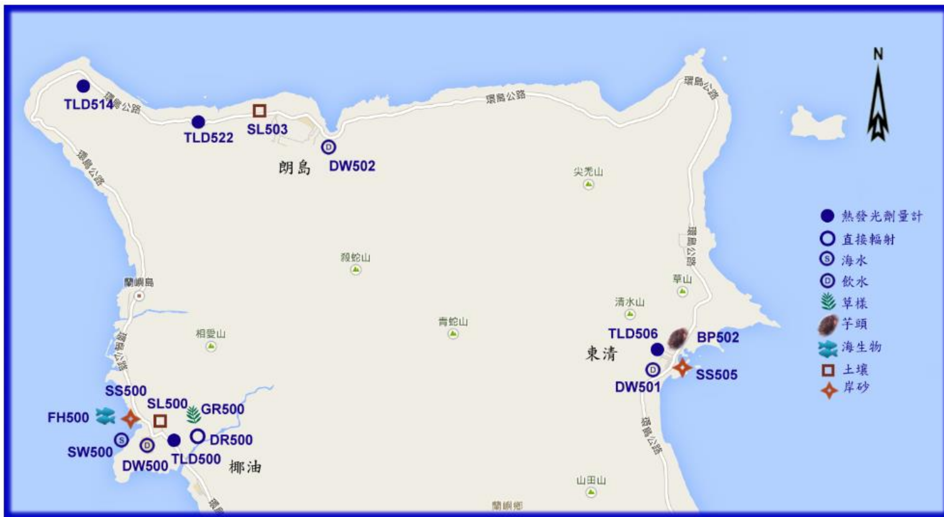
圖1-1 蘭嶼全島各類試樣取樣／監測站分佈圖(一)