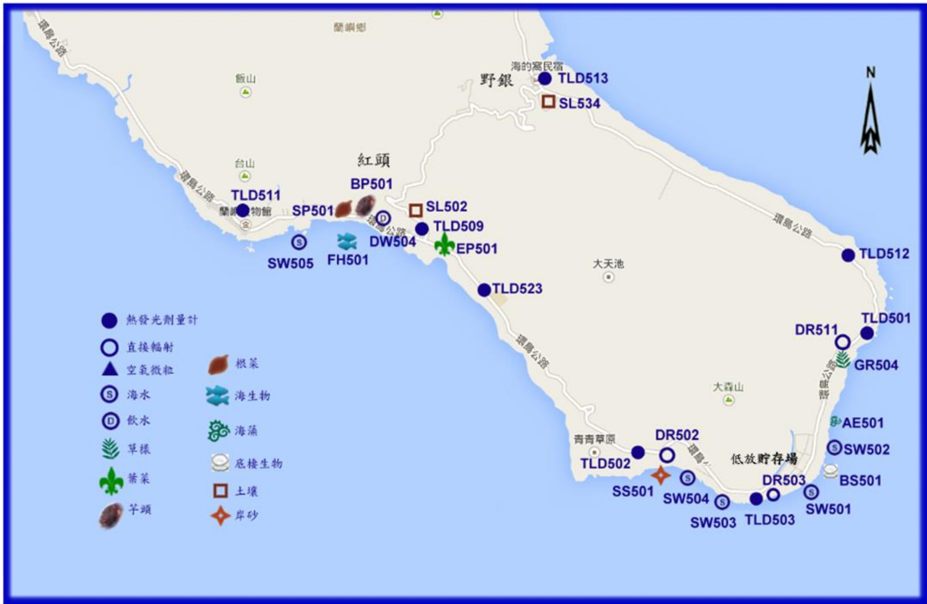
圖1-2 蘭嶼全島各類試樣取樣／監測站分佈圖(二)