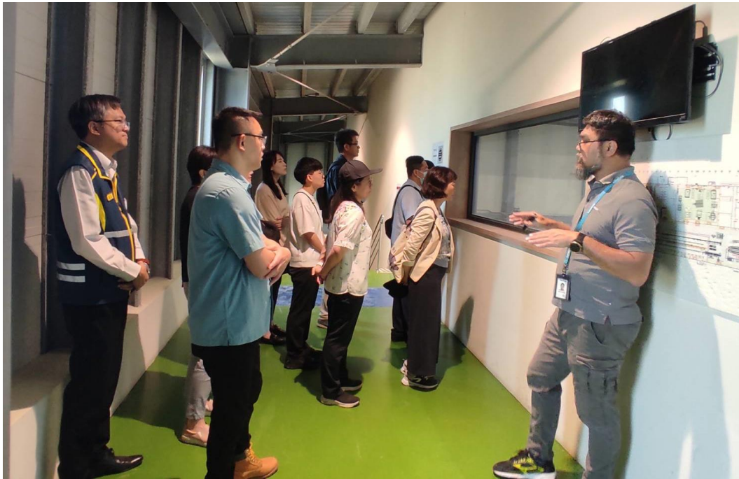
現場訪視風機葉片製造