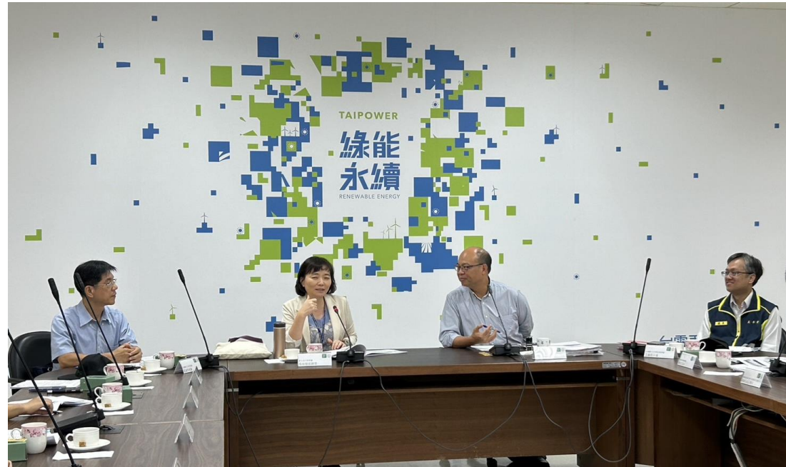
張檢察長曉雯意見交流