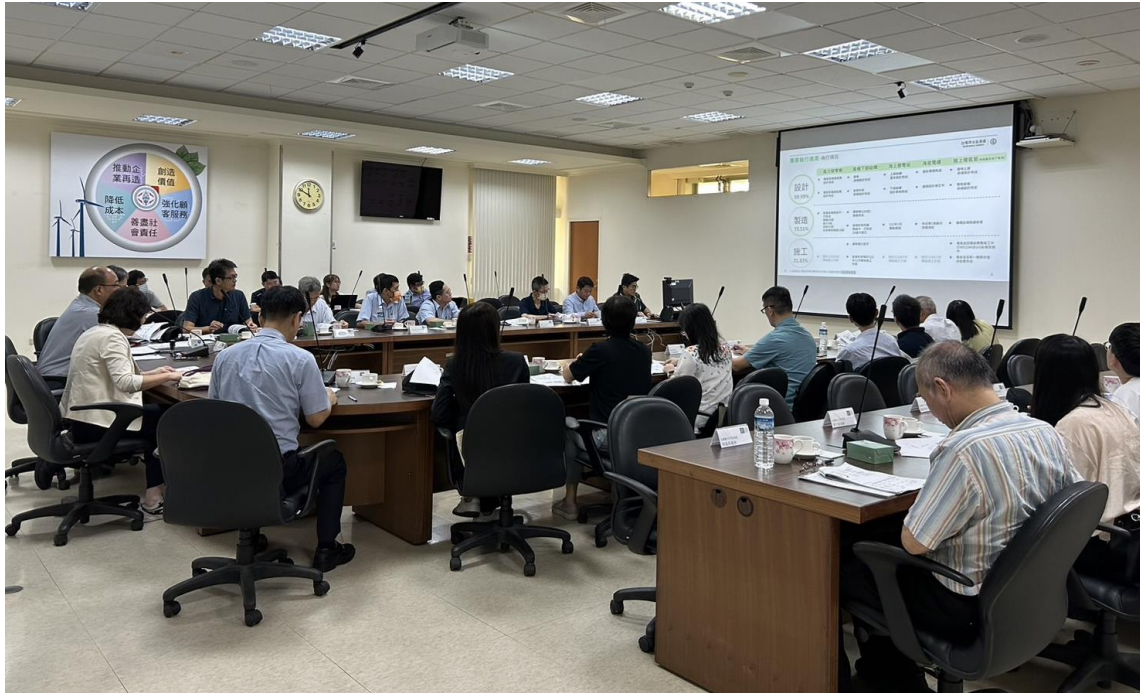
再生處劉經理建億簡報